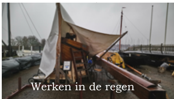
Werken in de regen