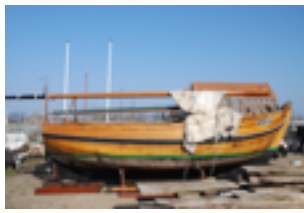
AAN DE SLAG